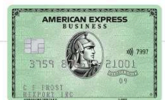
アメリカン・エクスプレス®・ ビジネス・カード