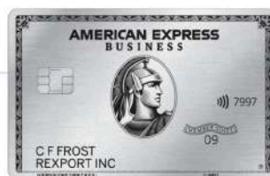
アメリカン・エクスプレス®・ ビジネス・プラチナ・カード