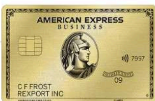
アメリカン・エクスプレス®・ ビジネス・ゴールド・カード

いつも、どんなときも、あなたのビジネスをサポート。 経費管理の効率化と資金繰りの改善に。